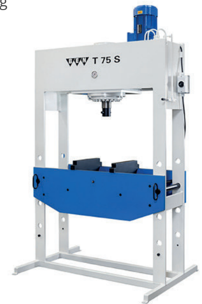
Werkstattpresse BEN T 75 S mit Prismenblöcken