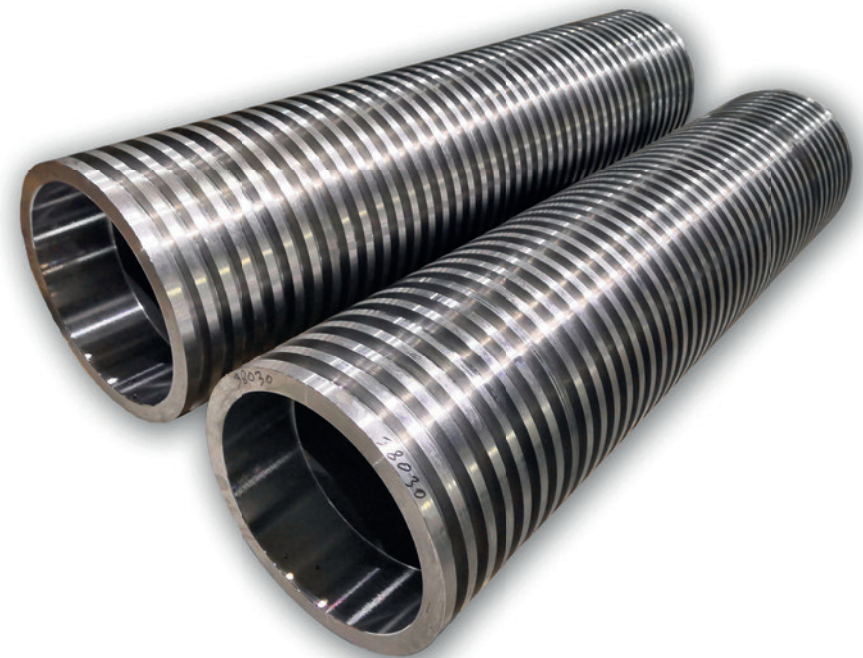
Einzugswalzen, gedreht, teilbearbeitet