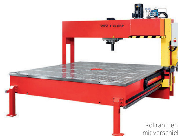
Rollrahmenpresse BEN T 75 SRP mit verschiebbarem Presszylinder