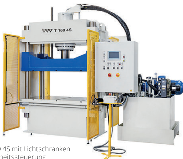
Viersäulenpresse BEN T 160 4S mit Lichtschranken und Pressen-Sicherheitssteuerung

Ein breit gefächertes Leistungsspektrum bildet die Basis für unsere Kompetenz. Damit sind wir seit über 29 Jahren ein unentbehrlicher Partner unserer Kunden bei allen Anforderungen. Ihre Wünsche realisieren wir mit kürzest möglichen Durchlaufzeiten durch effiziente Organisation.