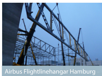
Airbus Flightlinehangar Hamburg

Rheiner Stahlbau GmbH Kanalstraße 7 48432 Rheine Tel. +49 5971 867-0