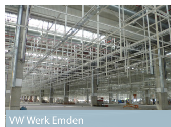
VW Werk Emden