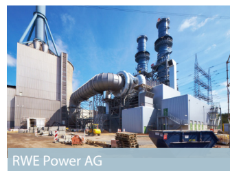
RWE Power AG