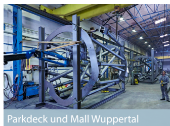
Parkdeck und Mall Wuppertal