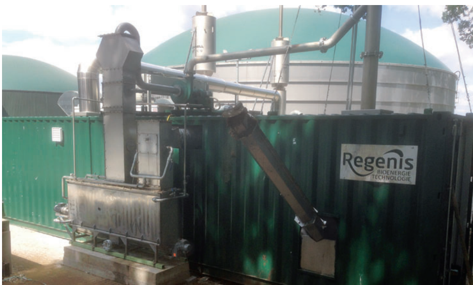
GärrestTrockner Regenig GT Außenansicht

In Vorbereitung: Der Bioenergieerzeuger Regenis REX Biomassevergaser Option für die Zukunft!