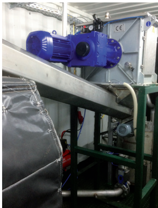
Gärresttrockner Regenig GT Innenansicht

Die feuchte Biomasse kann durch den Regenig GT wirtschaftlich und effizient in Wertstoffe umgewandelt und verkauft werden.