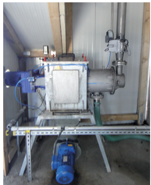
GärrestEntwässerer Regenis GE mit Gärrestförderer Regenis GF