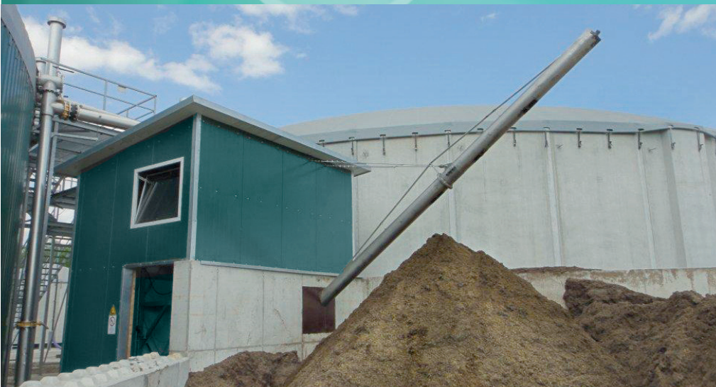
GärrestFörderer Regenis GF