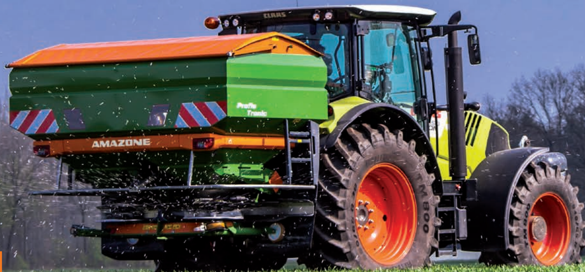
BILD: DER DÜNGERSTREUER ZA-TS 4200 IM EINSATZ