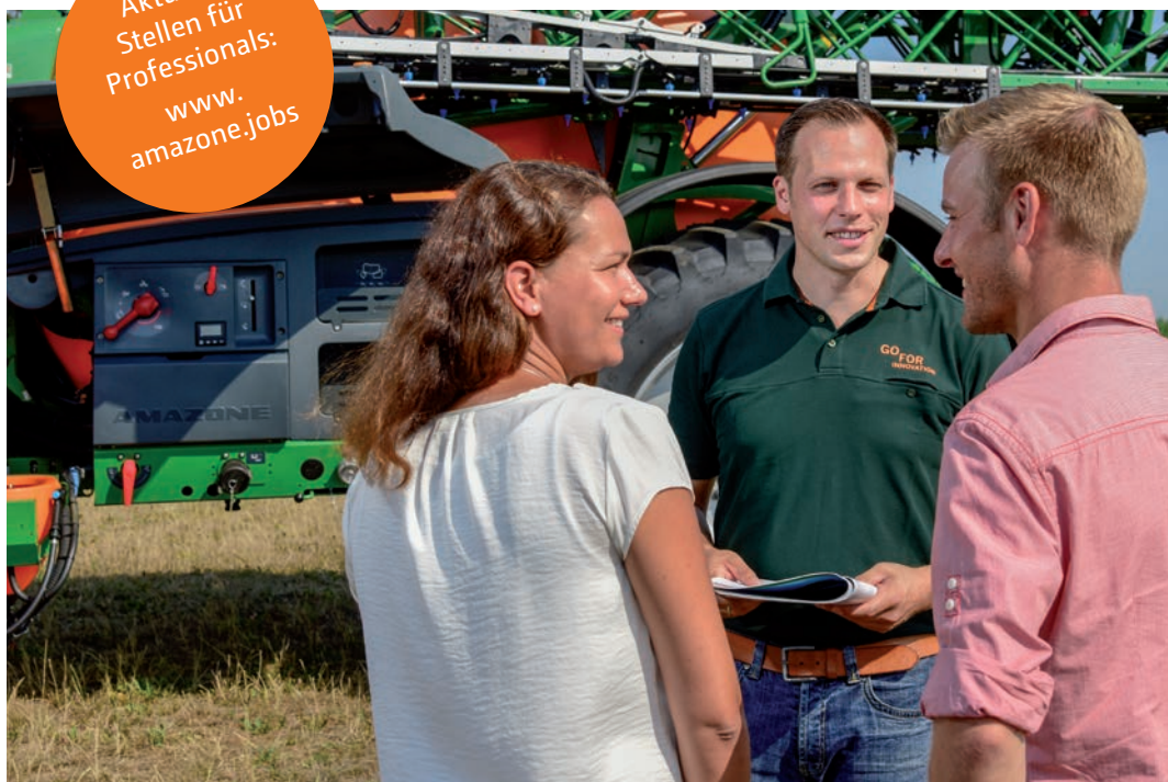
BILD: WERKSBEAUFTRAGTER IM KUNDENGESPRÄCH

Aktuelle Stellen für Professionals: www.amazone.jobs