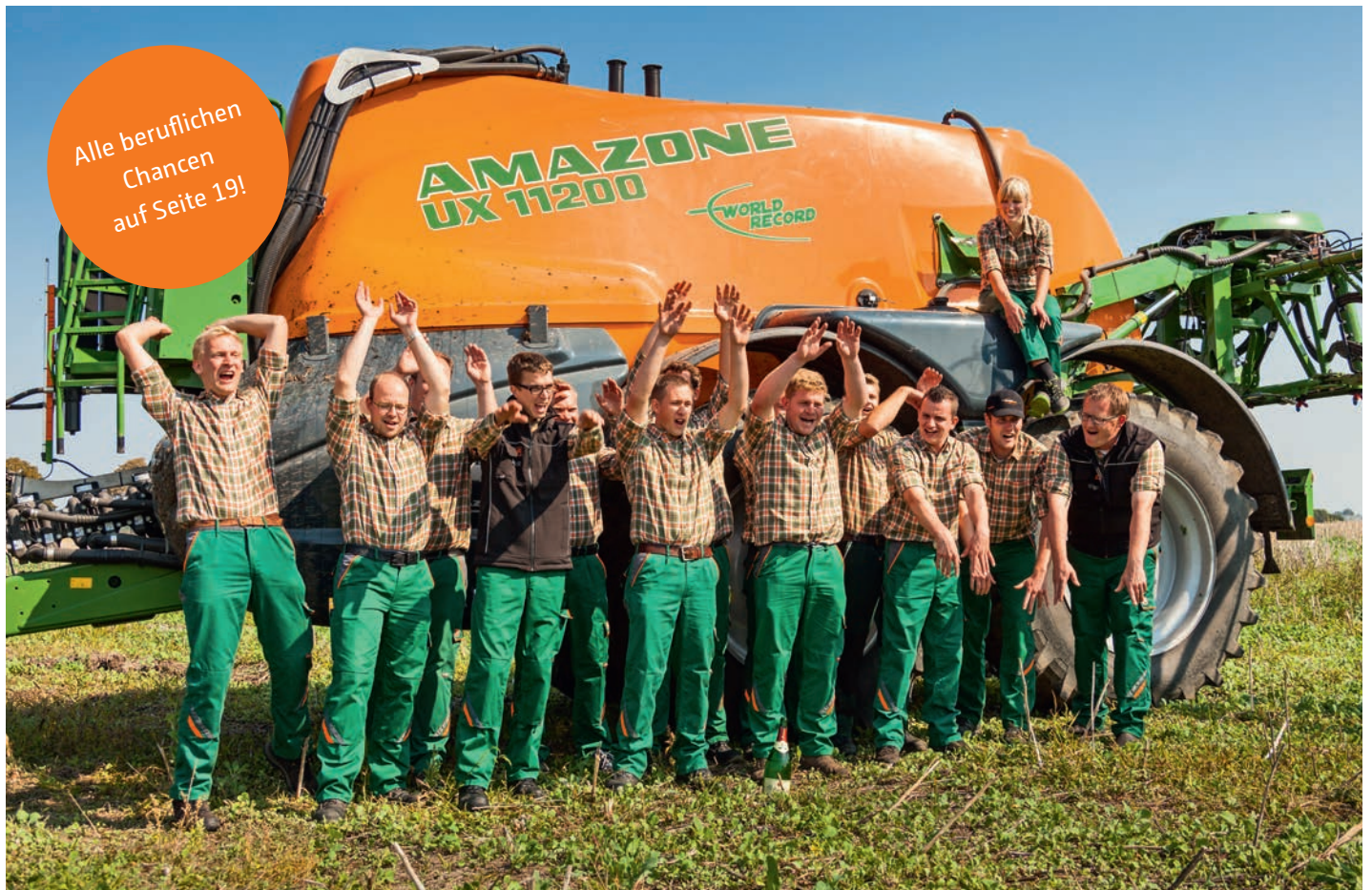
BILD: DAS AMAZONE WELTREKORDTEAM VON 2016